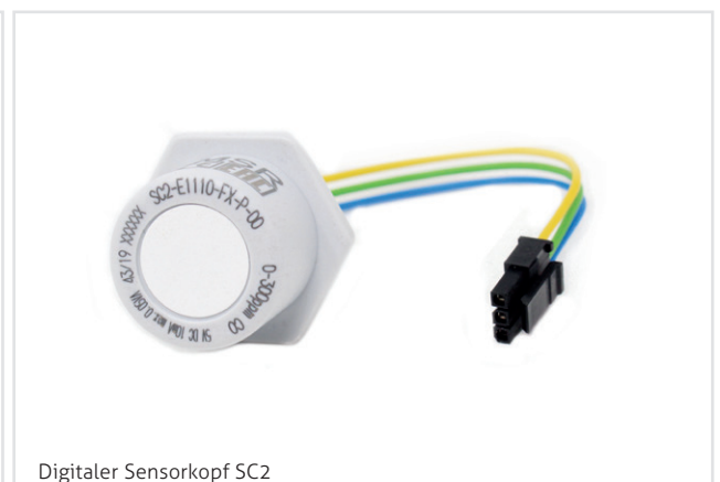
Digitaler Sensorkopf SC2