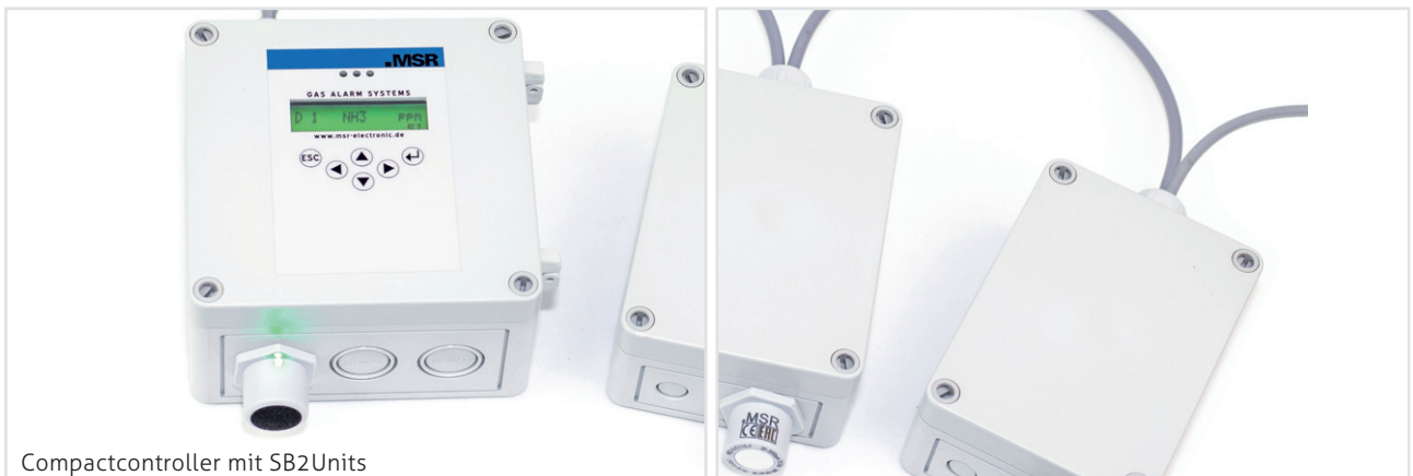
Compactcontroller mit SB2Units