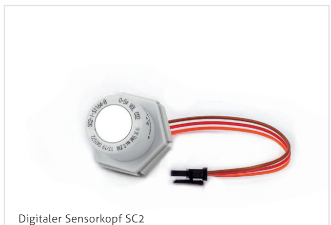
Digitaler Sensorkopf SC2