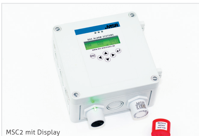
MSC2 mit Display